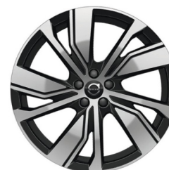
20" 5-Dubbel Spaaks Black / Diamond Cut 1133 (winterwiel)