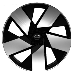
20" 5-Spaaks Black / Diamond Cut 1185