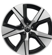
19" 5 Spaaks Black / Diamond Cut (winterwiel)