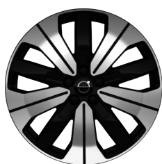
19" 5-Dubbel Spaaks Black / Diamond Cut