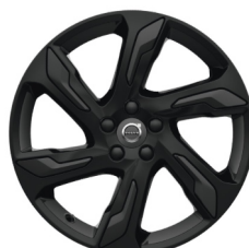
19" Alecto Glossy Black V40 Cross Country Accessoire