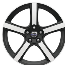
18" Midir Diamond Cut / Glossy Black V40 Accessoire