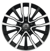
16" Markeb Black / Diamond Cut V40 Polar / Polar+