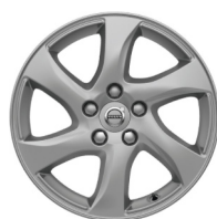
16" Geminus Silver Stone V40 Cross Country Accessoire