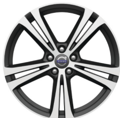
19" Artio Diamond Cut / Matt Tech Black V40 Accessoire