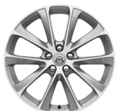
19" Damara Diamond Cut / Grey V40 Cross Country Accessoire