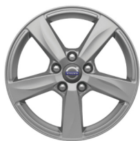
16" Matres Silver Stone V40 Accessoire