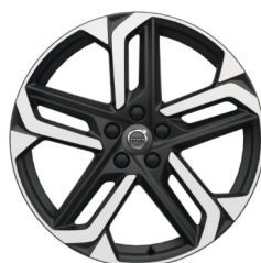
19" Atria Tech Matt Black / Diamond Cut V40 Cross Country Accessoire