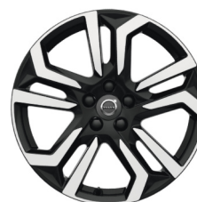
18" Metallah Black / Diamond Cut V40 Cross Country Accessoire