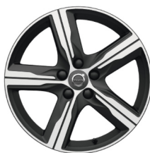
17" Ixion III Matt Black / Diamond Cut V40 Polar+ Sport