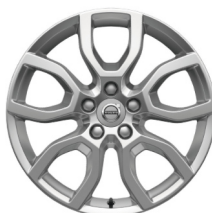
17" Keid Silver V40 Cross Country Polar+ Luxury