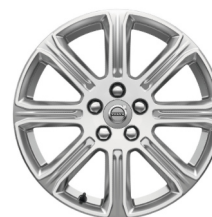
17" Sarpas Silver / Diamond Cut V40 Accessoire