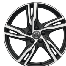
18" Ixion IV Matt Black / Diamond Cut V40 Accessoire