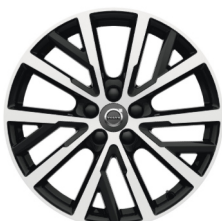
18" Narvi Black / Diamond Cut V40 Accessoire