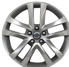
18" Tamesis Silver Bright V40 Accessoire