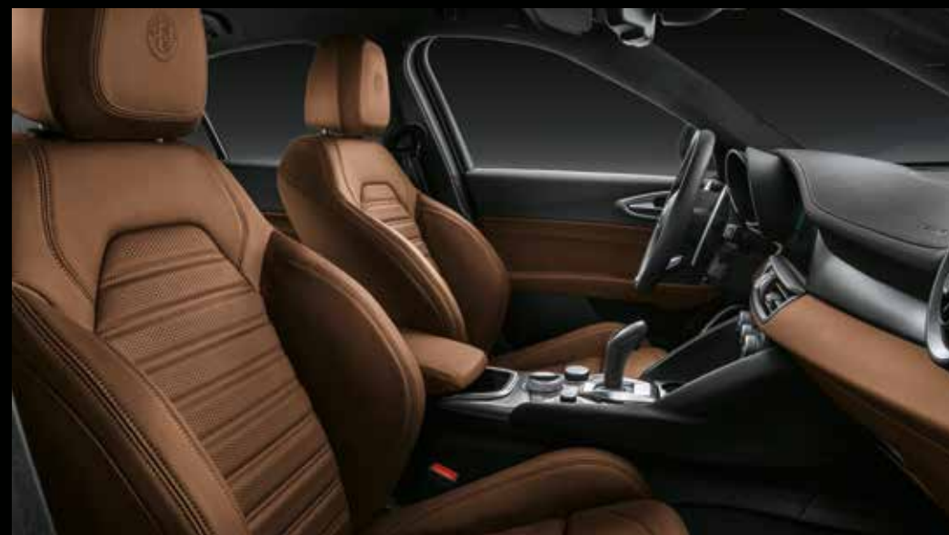
VELOCE - Tabacco lederen sportstoelen