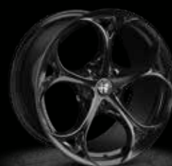
5EQ - 19" Performance Dark