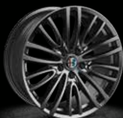
4AY - 18" Lusso