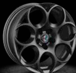
433 - 17" Sport