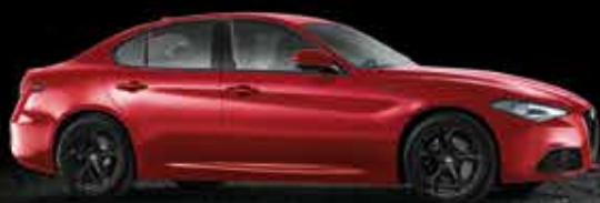
361 Rosso Competizione