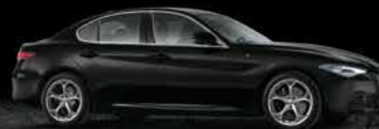
601 Nero Alfa