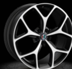
6G7 - 19" Style Diamond