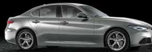
318 Grigio Stromboli