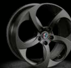
68P - 18" Sport Matt