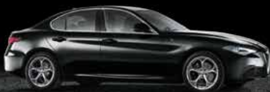
408 Nero Vulcano