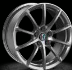
420 - 17" Super