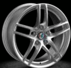
421 - 16" Giulia