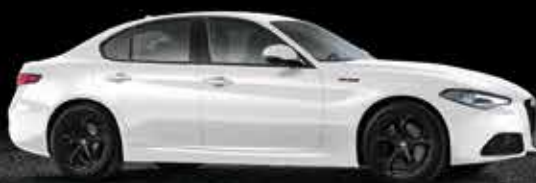
248 Bianco Trofeo