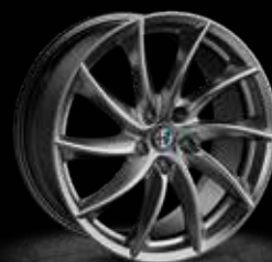
4WQ - 18" Veloce Dark