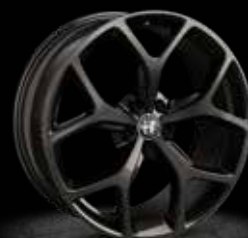
5FB - 19" Style Dark