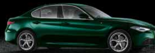
800 Verde Visconti