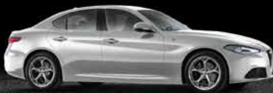
620 Argento Silverstone