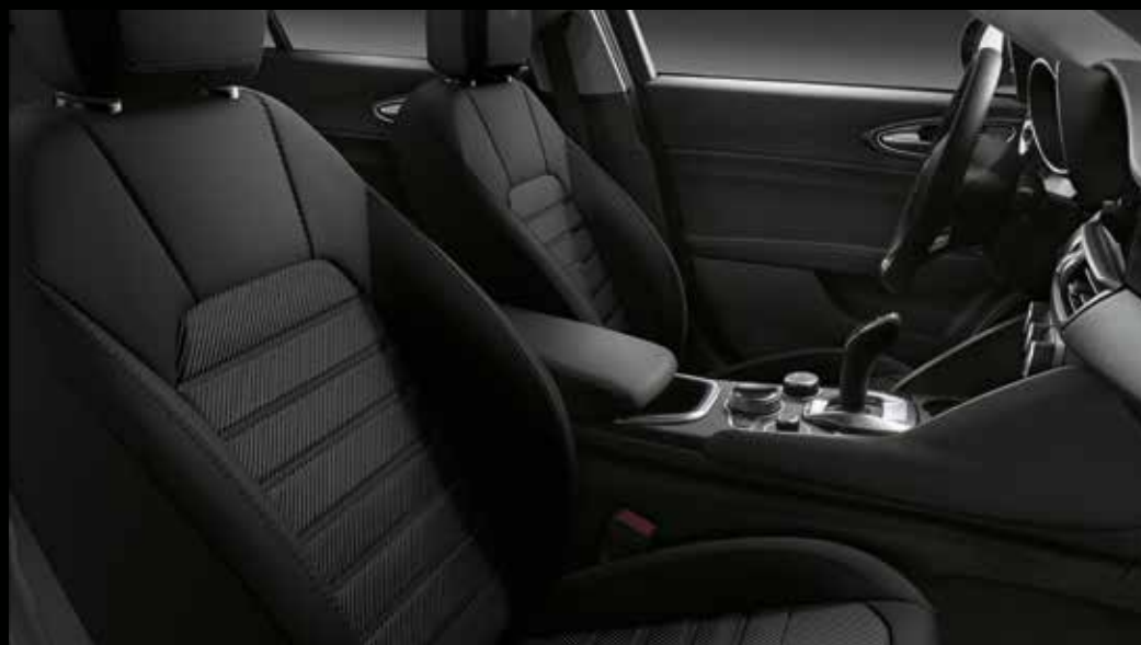
SUPER - Zwarte stof met donkergrijze stiksels