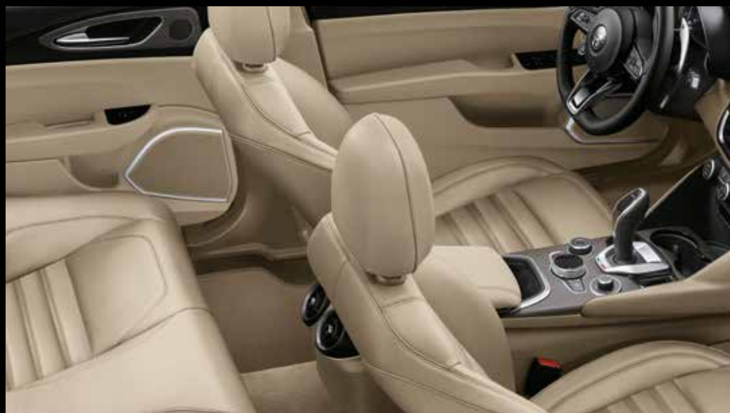
TI -Beige Pieno Fiore-leder (walnoot-/eikenhout)