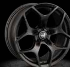
WPC - 18" Sprint