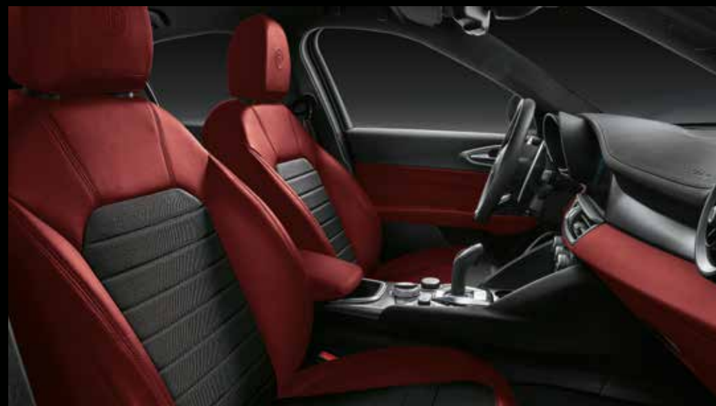
SPRINT - Zwart/rood stof/leder