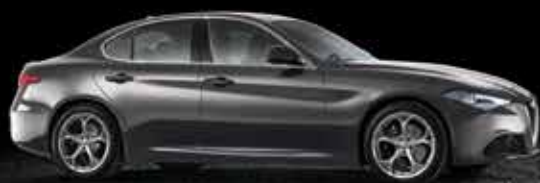
035 Grigio Vesuvio