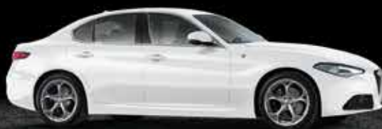
217 Bianco Alfa