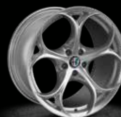
6Y8 - 19" Performance Silver