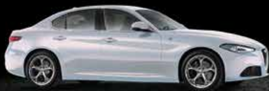
252 Bianco Lunare