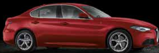
414 Rosso Alfa