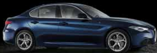
092 Blu Montecarlo