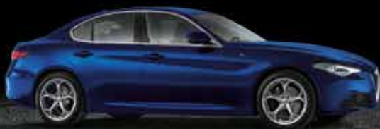
486 Blu Anodizzato