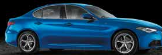
756 Blu Misano