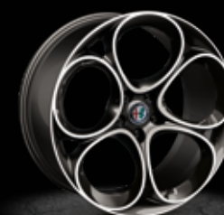
9GF - 19" Performance